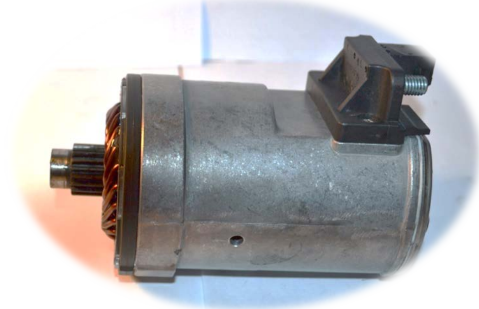
ELEKTROMOTOR S CENTRÁLNÍM KOLEM