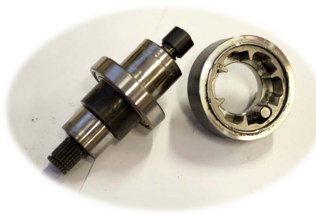
SESTAVA UNAŠEČE – HŘÍDELE S KULIČKOVÝM LOŽISKEM A VOLNOBĚŽKOU