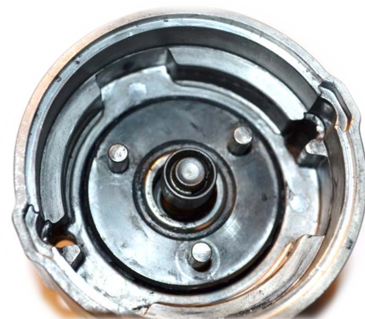
VOLNOBĚŽKA S ČEPY PRO ULOŽENÍ SATELITŮ V PŘEVODOVÉ SKŘÍŇI