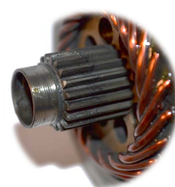
DETAIL - CENTRÁLNÍ KOLO S VINUTÍM ROTORU