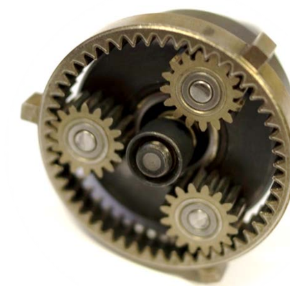
KORUNOVÉ KOLO SE SATELITY A ULOŽENÍ PRO CENTRÁLNÍ KOLO