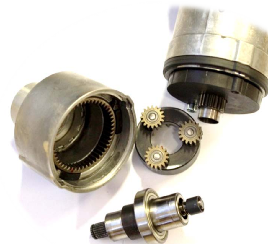
DÍLY PŘEVODOVÉ ČÁSTI STARTÉRU