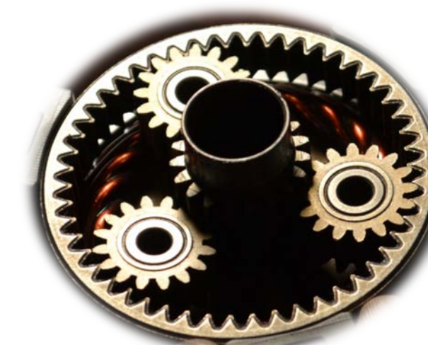
DETAIL PLANETOVÉHO PŘEVODU