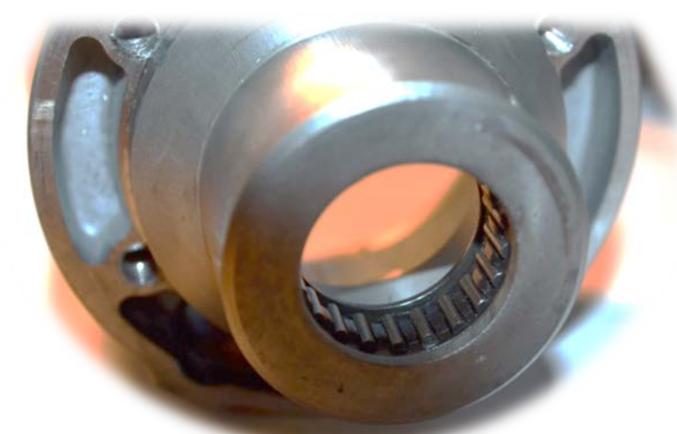
DETAIL – JEHLOVÉ LOŽISKO PŘEVODOVÉ SKŘÍŇE