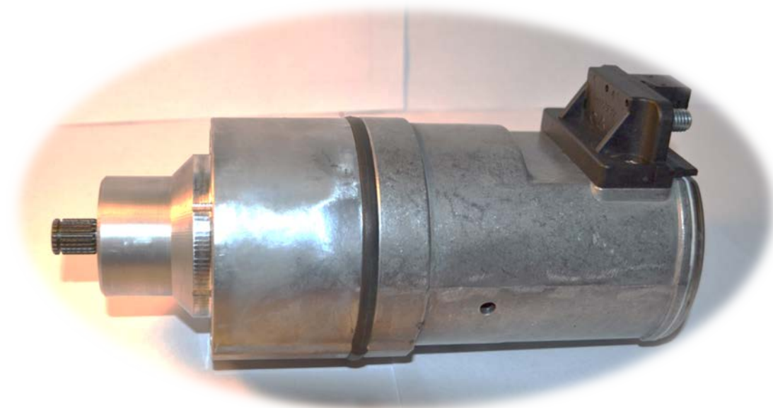
STARTÉR (BEZ PASTORKU)