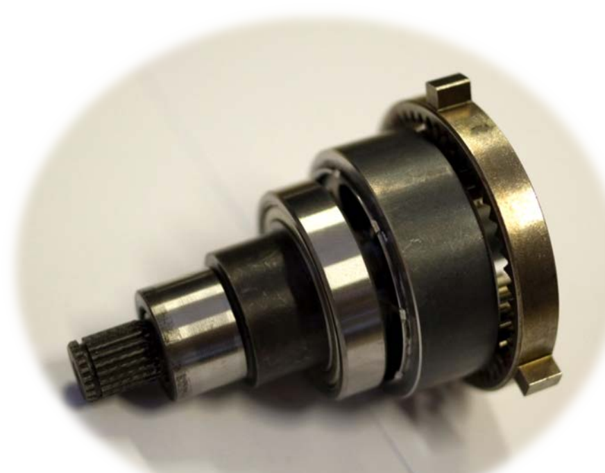
SESTAVA KORUNOVÉHO KOLA, SATELITŮ, UNAŠEČE A VÝSTUPNÍ HŘÍDELE