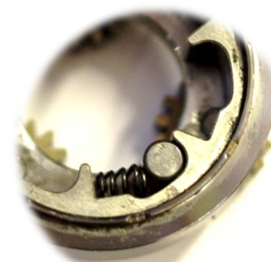
DETAIL – VĚNEC VOLNOBĚŽKY S VÁLEČKEM VE SVĚRNÉ DUTINĚ A S PRUŽINOU